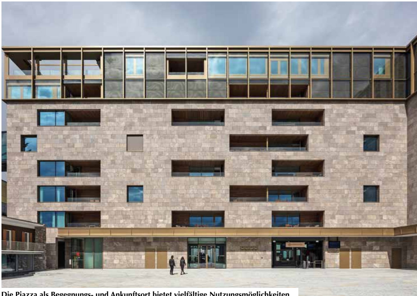
Die Piazza als Begegnungs- und Ankunftsort bietet vielfältige Nutzungsmöglichkeiten.