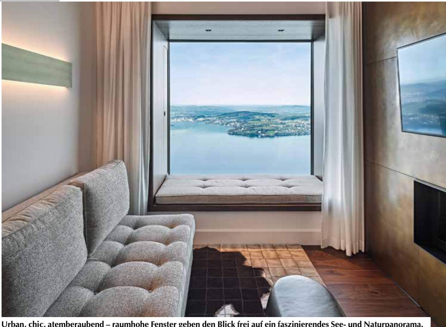
Urban, chic, atemberaubend – raumhohe Fenster geben den Blick frei auf ein faszinierendes See- und Naturpanorama.