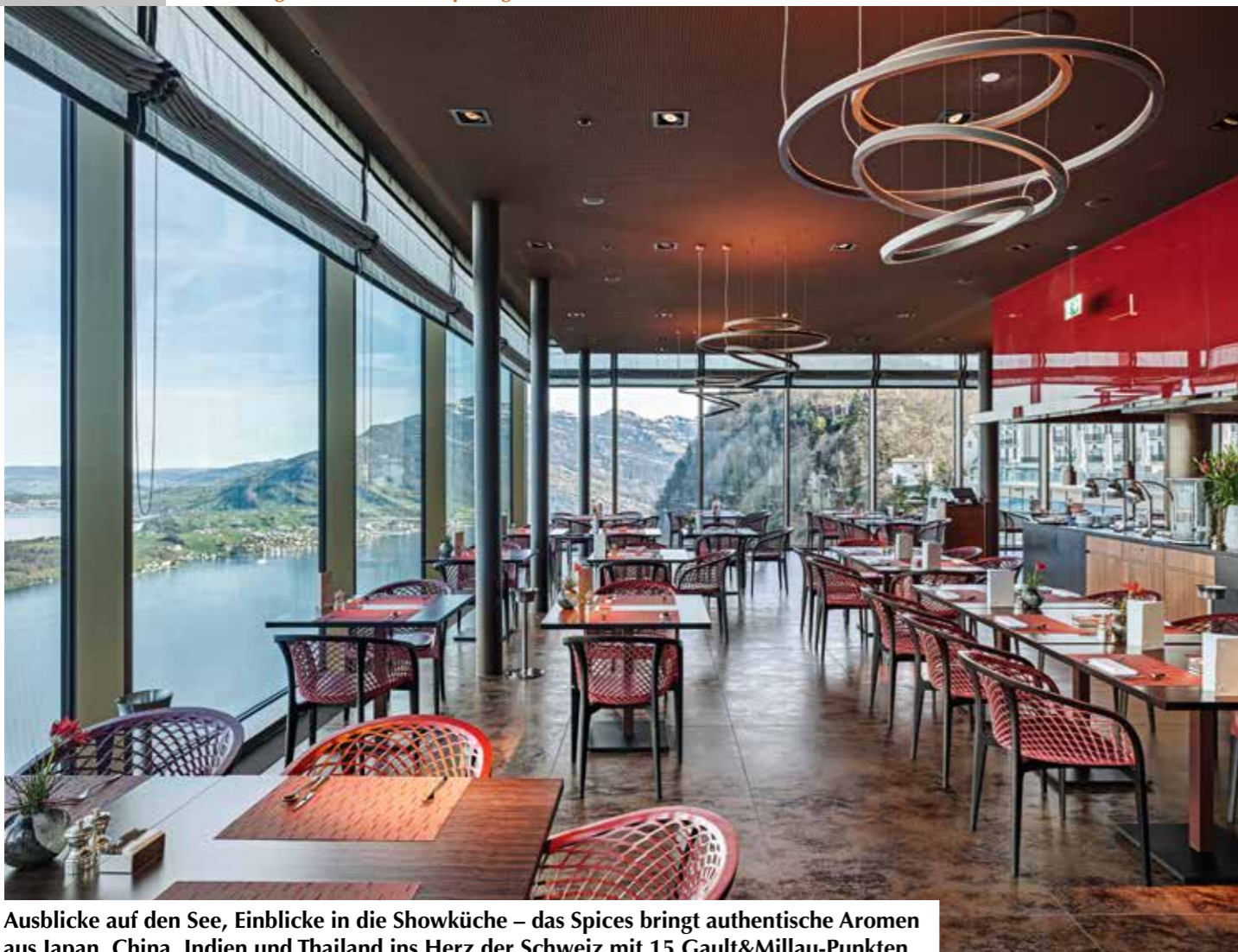
Ausblicke auf den See, Einblicke in die Showküche – das Spices bringt authentische Aromen aus Japan, China, Indien und Thailand ins Herz der Schweiz mit 15 Gault&Millau-Punkten.