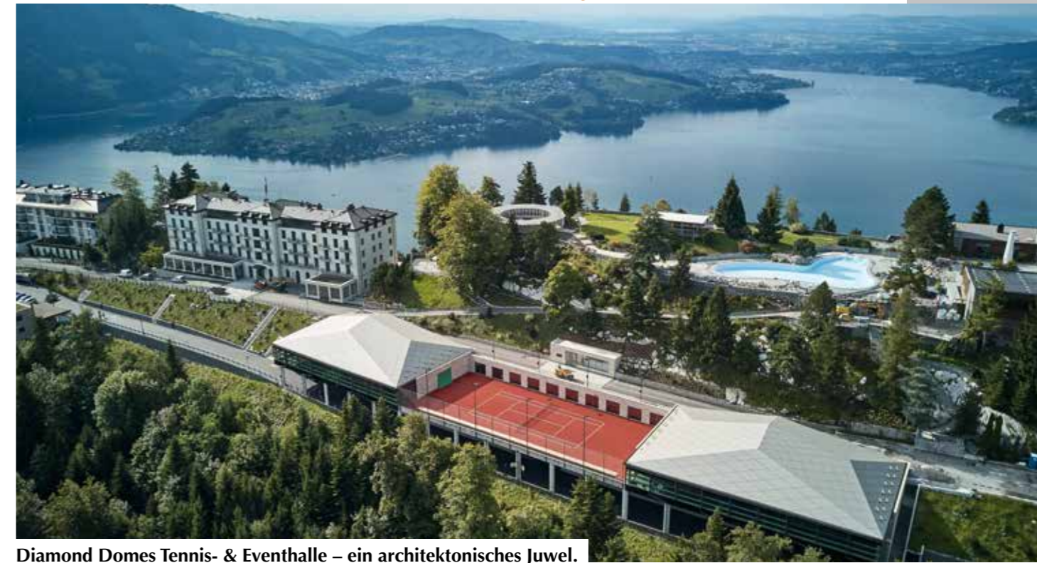
Diamond Domes Tennis- & Eventhalle – ein architektonisches Juwel.