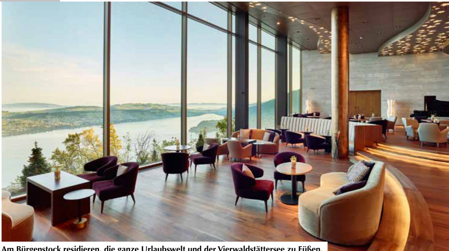
Am Bürgenstock residieren, die ganze Urlaubswelt und der Vierwaldstättersee zu Füßen.