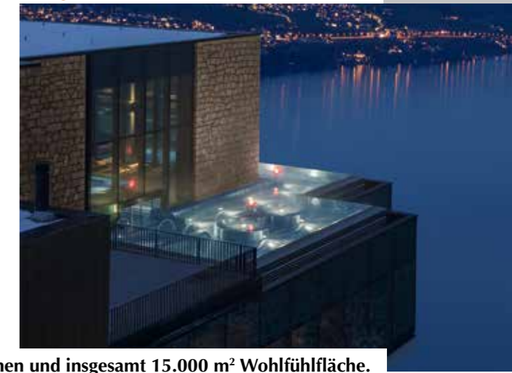
Die Bürgenstock Hotels & Resorts mit drei Luxus-Spa-Bereichen und insgesamt 15.000 m 2 Wohlfühlfläche.