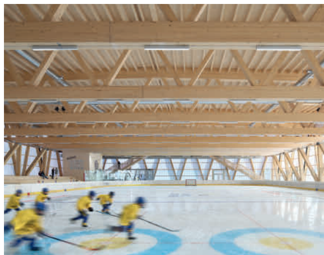
▲ Innenansicht. Foto: Fanzun AG Architekten Ingenieure Berater

zugewandten Oberflächen aufgrund des Strahlungsaustausches einige Grad kälter als die Raumtemperatur, was die Gefahr von Kondensatbildung zusätzlich erhöht. Die Feuchteschwankungen sowie die Möglichkeit von Tauwasserbildung sind für Holzbauten nicht ideal und müssen in der Planung berücksichtigt werden. Je kleiner das Hallenvolumen, desto weniger Luft steht für die kurzzeitige Feuchteaufnahme bereit. Dieser Umstand führte beim vorliegenden Projekt zum Einbau einer Entfeuchtungsanlage, damit es sowohl für die Sportler als auch für das Holz nicht zu feucht ist. Die Konstruktion wurde mit einer digitalen Bauwerksüberwachung ausgestattet. Die Resultate der Holzfeuchtemessungen zeigen, dass die künstliche Entfeuchtung in dieser Hallengrösse zwingend erforderlich ist. Bei einem Ausfall der Anlage gingen