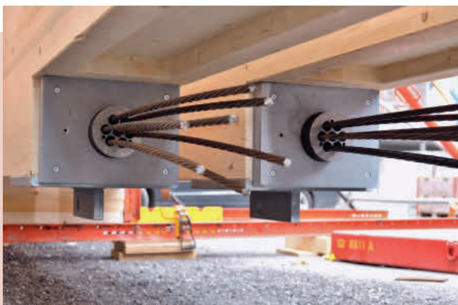
▲ Verankerung Stahl-Litzen.

Die Fachwerke sind in Feldmitte komplett gestossen. Die Stoss-Druckkräfte im Obergurt konnten relativ einfach über einen GSA-Vergussstoss gelöst werden. Dieser Montagestoss mit eingeklebten GSA-Bügeln, die auf der Baustelle durch einen Querstab mit Mörtel verbunden werden, ermöglicht auch die Aufnahme von gewissen Bautoleranzen. Etwas schwieriger wurde es, die grossen Zugkräfte im Untergurt zu verbinden. Die Zugkräfte auf Bemessungsniveau liegen bei 3300 kN. Mit den gewünschten Holzquerschnitten reichte die Leistungsfähigkeit des GSA-Vergussstosses an diesem Punkt nicht aus. Die Verbreiterung der Träger war nicht erwünscht. Eine Erhöhung des Untergurtes geht bei fixierter Gesamthöhe immer zu Lasten der statisch wirksamen Höhe. Aufgrund der dadurch wachsenden Normalkräfte erwies sich auch diese Option als Sackgasse. Gelöst wurde das Problem